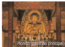
Hondo (pavilhão principal)

A imagem de Buda principal do pavilhão principal do Chusonji é um Shaka Nyorai (Buda histórico) de joroku (5,3m). Uma cerimônia de homenagem póstuma mensal para os membros das quatro gerações do clã Fujiwara, cerimônias de homenagens póstumas para os ancestrais da seita Tendai, transcrição do Sutra do Lutos ao longo do dia e outros ritos budistas são realizados neste local. Dentro do pavilhão estão as chamas eternas, acendidas a partir da chama existente no templo principal da seita Tendai, o Enryakuji, que é famosa por estar acesa desde que foi acendida pelo fundador da seita, Saicho (Dengyo Daishi), mais de 1.200 anos atrás. As cerimônias de homenagem póstuma da família, meditação zazen e transcrição de sutras também são realizadas aqui.