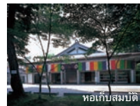
หอเก็บสมบัติ

เป็นที่เก็บสมบัติของชาติและมรดกทางวัฒนธรรมที่ สำคัญกว่า 3,000 รายการ ภายในจัดแสดงพระพุทธรูป เครื่องสักการะ พระสูตร ภาพเขียน ตลอดจนสมบัติของตระกูลฟูจิوارهให้ได้ชมกัน